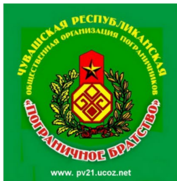
Чувашская республиканская общественная организация пограничников «Пограничное братство»